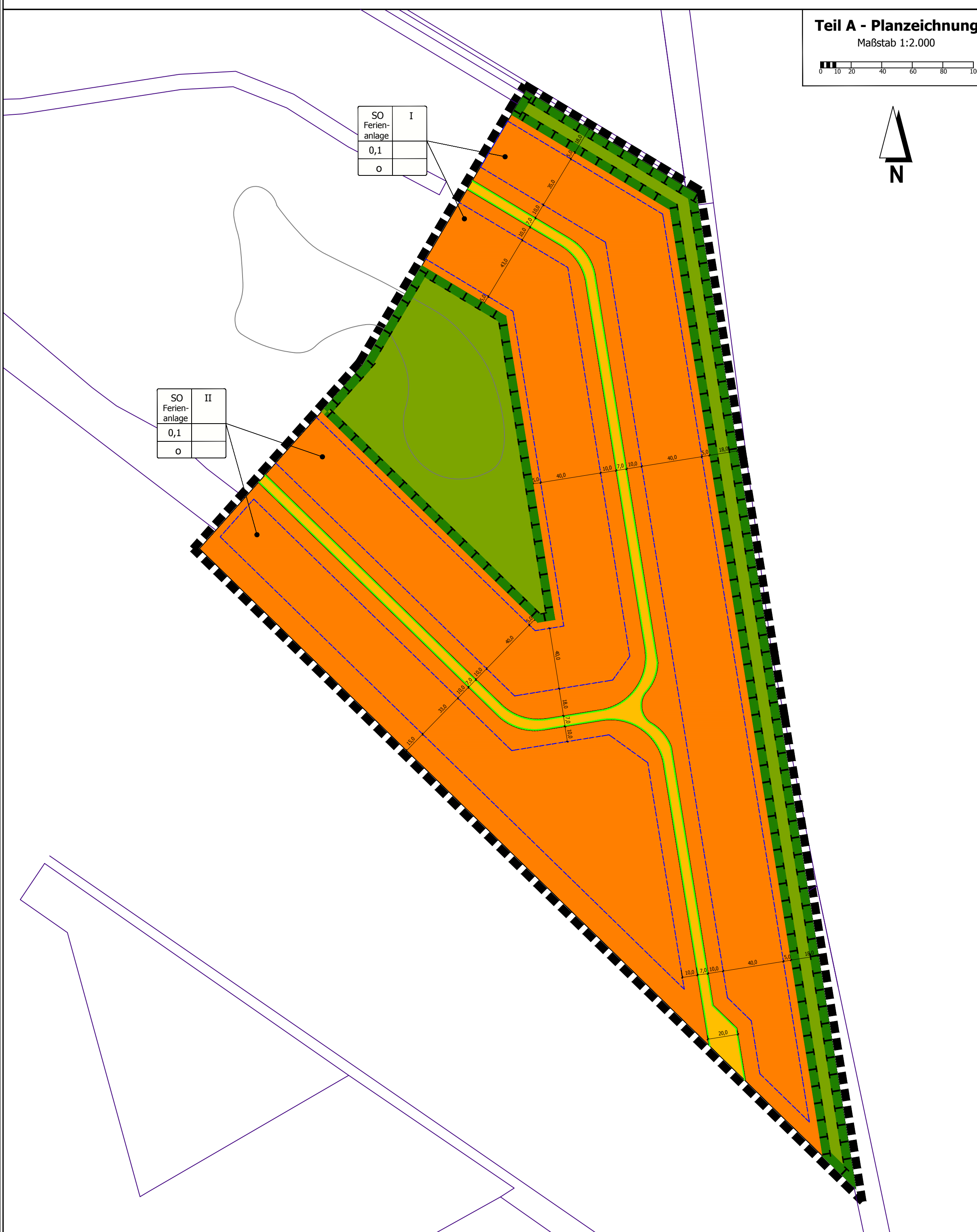
Teil A - Planzeichnung Maßstab 1:2.000